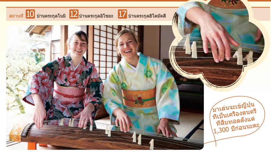
สถานที่ 10 บ้านตระกูลโอบะ

กิจกรรมทั้งหมดไม่คิดค่าบริการ แต่ท่านต้องเสียค่าเช่าชม โดยหากท่านใส่ชุดกิโมโนจะได้เข้าชมฟรี สอบถามรายละเอียดได้จากเจ้าหน้าที่แต่ละแห่ง