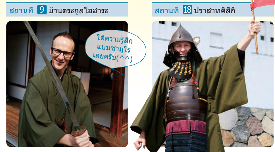
สถานที่ 9 บ้านตระกูลโอบาระ

กิจกรรมทั้งหมดไม่คิดค่าบริการ แต่ท่านต้องเสียค่าเช่าชม โดยหากท่านใส่ชุดกิโมโนจะได้เข้าชมฟรี สอบถามรายละเอียดได้จากเจ้าหน้าที่แต่ละแห่ง