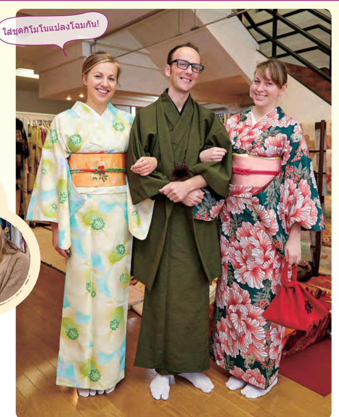
ใส่ชุดกิโมโนแปลงโฉมกัน!