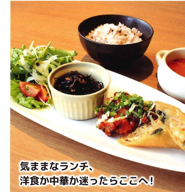
気ままなランチ、洋食が中華が迷ったらここへ!

イチ押し プレートランチ 950円 (税込) 当店の人気メニューであるチキン南蛮、パリパリ春巻き、ポテトサラダが一皿でお楽しみ頂けます。特に女性のお客様に人気です。 オススメ ・オムライス 660円 (税込) ・豚豚 990円 (税込) 営業時間: 11:30~14:30 / 17:30~21:00 休 火曜日、第2・4月曜日 ㊟ 19席 駐 8台 杵築市大字守江 1171 ☎090-1678-2878