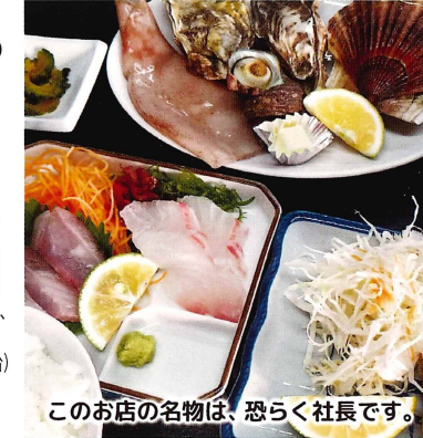
このお店の名物は、恐らく社長です。

イチ押し 海鮮炭火焼きコース 3,300円 (税込) 一年中、牡蠣焼きや海鮮焼きが楽しめます。自慢の海鮮丼や大分和牛のBBQも人気です。団体での利用もできます。 オススメ ・りゅうきゅう丼 (お味噌汁、お漬物付) 990円 ・天ぷらじゃこ天・他 220円~ 営業時間: 11:00~18:00 (入店16:30まで) 4月~10月 / 11:00~21:00 (入店19:30まで) 11月~3月 休 元旦、4月~10月は毎週木・金曜日、11月~3月無休 ㊟ 104席 座 18席 駐 30台 (バス5台) 杵築市守江 4775-9 ☎0978-63-9100