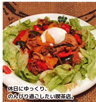
休日にゆっくり、のんびり過ごしたい喫茶店。

イチ押し アジアンカボス丼 (ドリンク付) 1,000円 (税込) ピリッとした豆板醤の辛みと、さわやかなカボスの酸味がベストマッチ! 1日の野菜接種目標量の半分以上が摂れる自慢の丼ぶりです。 オススメ ・杵築ポリタン (ドリンク付) 1,030円 (税込) 営業時間: 8:00~17:00 休 毎週月・火曜日 席 29席 駐 20台 杵築市大内 4537-28 ☎0978-64-1960