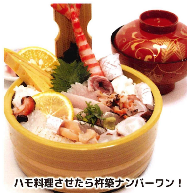
ハモ料理させたら杵築ナンバーワン!

イチ押し 海鮮ざこば丼 (上) 1,650円 (税込) 魚料理が旨い店。海の幸が器にのった人気の海鮮丼。上、特、極上3種で色々楽しめる。 オススメ ・寿司定食 1,700円 (税込) ・ハモ重 1,650円 (税込) 営業時間: 11:00~14:00 / 17:00~22:00 休 不定休 ㊟ 7席 座 24席 駐 10台 (バス1台) 杵築市猪尾 203-1 ☎0978-63-6771