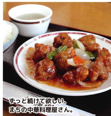
ずっと続けて欲しい、まちの中華料理屋さん。

イチ押し ハモ団子とスプタの甘酢定食 (杏、スープ、ライス付き) 880円 (税込) きつきで獲れた鯉の揚げ団子と中華のスプタを一皿に入れました。 オススメ ・チリメン天津丼定食 (杏、スープ付) 880円 (税込) ・トリ天定食 (杏、スープ、ライス付) 770円 (税込) 営業時間: 11:30~15:00 (L.O. 14:30) / 17:00~21:30 (L.O. 21:10) 休 毎週木曜日 ㊟ 12席 座 32席 駐 10台 杵築市大内 3406-3 ☎0978-62-5011