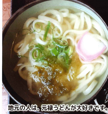
地元の人は、元禄うどんが大好きです。

イチ押し うどん (そば) 定食 790円 (税込) うどん (そば) と玉子丼小のセットでお得です。 オススメ ・特製元禄うどん 1,060円 (税込) ・味噌うどん 820円 (税込) 営業時間: 11:00~20:30 (オーダーストップ) 休 毎週水曜日 ㊟ 68席 座 24席 駐 35台 杵築市守江 3899-1 ☎0978-62-3838