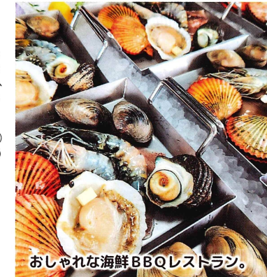
おしゃれな海鮮BBQレストラン。

イチ押し 牡蠣焼き (一盛約1kg) 1,430円 (税込) (期間: 11月~5月上旬) キツキテラスでは、24時間以上紫外線殺菌装置で濾過した牡蠣のみをご提供しています。牡蠣を殻ごと焼いて、旨味をしっかりと閉じ込めた牡蠣本来の美味しさをご堪能いただけます。 オススメ ・ぜいたく釜飯 935円 (税込) ・海鮮焼き 3,300円 (税込) 営業時間: 10:30~16:00 (L.O. 15:30) 休 不定休 (要問い合わせ) ㊟ 27テーブル (108席) 駐 77台 杵築市守江 4785番地 ☎0978-63-8085