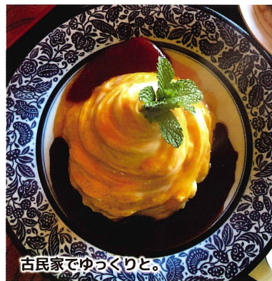
古民家でゆっくりと。

イチ押し ラーニオムライス (ハンバーグ又は、エビフライ又は、チキン南蛮 + サラダ みそ汁付き) 1,370円 (税込) とろとろの卵をまとったケチャップとバターが食欲をそそるラーニオムライスと当店自慢のチキン南蛮、ハンバーグ、エビフライの中から選べるボリュームメニューです。 オススメ ・がっつりごはん (チキン南蛮、ハンバーグ、エビフライ、カツ、みそ汁) 1,770円 (税込) ・パンダランチセット (サラダ、パン、みそ汁) 1,270円 (税込) 営業時間: 11:30~14:30 / 18:00~22:00 休 水曜日 席 26席 駐 16台 杵築市八坂 2696-5 ☎0978-62-2501