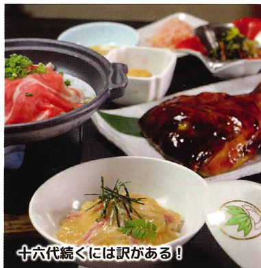
十六代続くには訳がある!

イチ押し 竹の膳 2,800円 (税込) 鯛茶漬けうれしのと、隠れた当店の名物鯛の兜焼きがついた、満足頂けるボリュームランチです。 オススメ ・梅の膳 (小鉢、茶碗蒸、鯛茶漬け、デザート) 2,200円 (税込) 営業時間: 11:00~15:00 (L.O. 14:30) / 17:00~22:00 (予約のみ) 休 年末年始 席 一部屋最大収容人数 200、全体 500 駐 30台 (バス4台) 杵築市杵築 665-429 ☎0978-63-5555